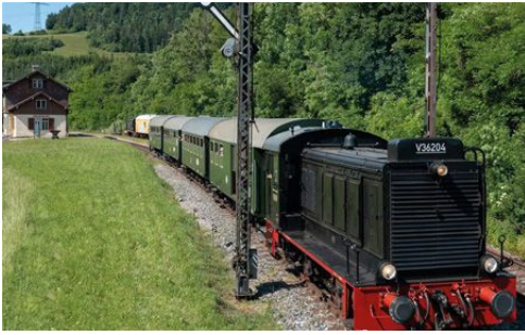
Sauschwänzlebahn im Süd-Schwarzwald