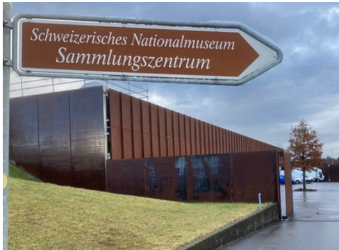
Führung im Schweiz. Nationalmuseum