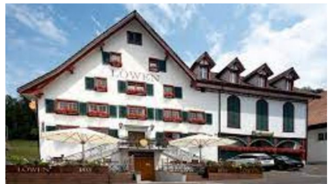
Restaurant Löwen in Hausen a.A.