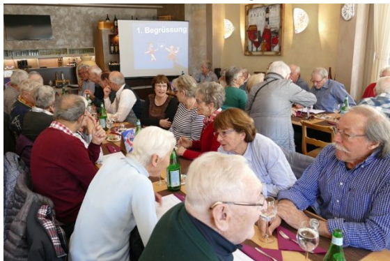
Auch diesmal «Full House» im Rest. Trambli

Statistisch gesehen war der Erfolg der diesjährigen Vereinsversammlung eigentlich schon vorprogrammiert, denn die massgebenden Zahlen waren fast durchwegs positiv. Mit über 80 Anmeldungen war wieder